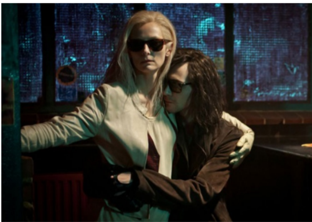
Only Lovers Left Alive

Para além da estreia prevista dos vencedores dos festivais de Cannes, Berlim, Veneza, Locarno e Sundance [ A Vida de Adèle: capítulos 1 e 2 , Child's Pose , Sacro Gra* , História de la meva mort e Fruitvale Station , respetivamente], o LEFF vai apresentar em antestreia os novos filmes dos irmãos Coen ( Inside Llewyn Davis ), de Roman Coppola ( A Glimpse Inside the Mind of Charles Swan III ), de Roman Polanski ( La Vénus à la fourrure ), de Hirokazu Koreeda ( Like Father, Like Son ), de Sarah Polley ( Histórias que Contamos ), de Asghar Farhadi ( O Passado ) e Jim Jarmusch ( Only Lovers Left Alive ).