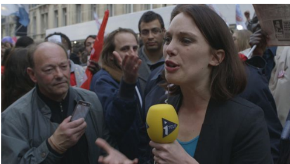
A Batalha de Solferino