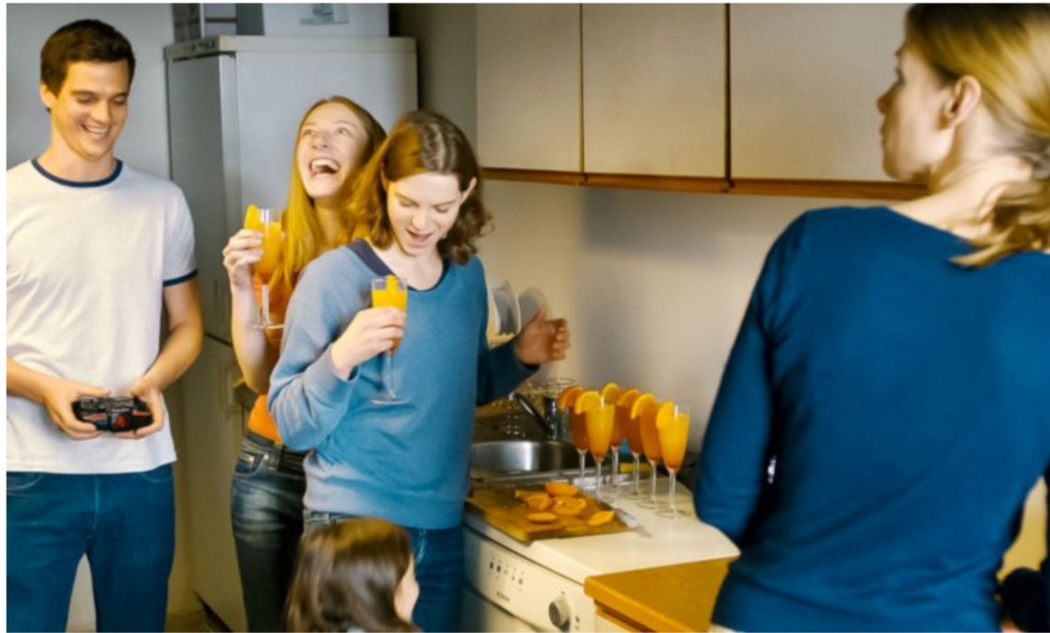
"Strange Little Cat", do suíço Ramon Zürcher

Três filmes da competição do Lisbon & Estoril Film Festival, três experiências formais oriundas da produção alternativa.